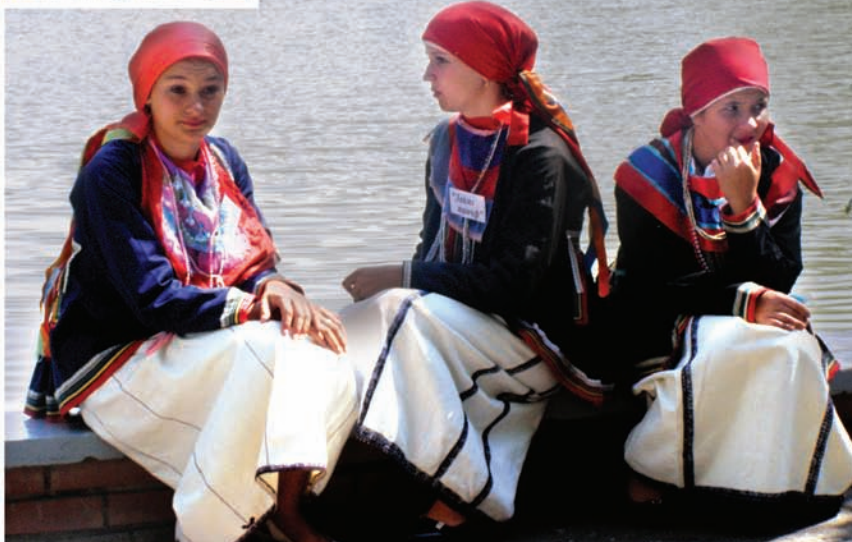
ЖИВИ В ВЕКАХ РОССИЙСКОЕ СЕЛО