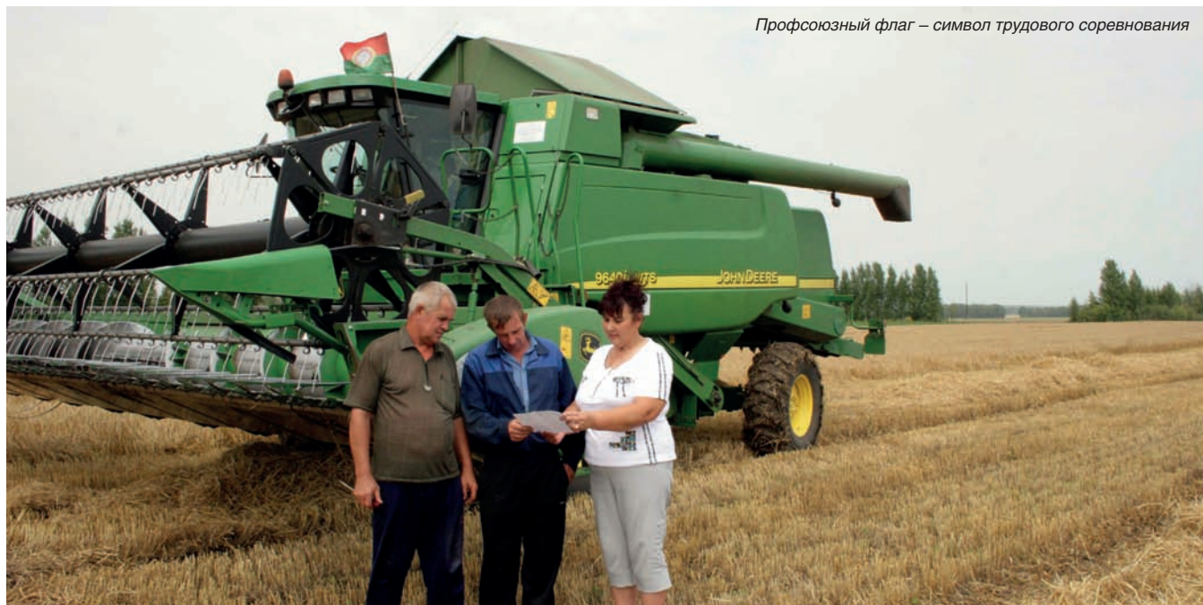
Профсоюзный флаг – символ трудового соревнования

Наиболее острые дискуссии с приезжими экономистами возникают по поводу того, что оснащение хозяйства самой современной техникой сопровождается реорганизацией и сохранением рабочих мест. Труженики, которые вложили свой труд в экономическое развитие хозяйства не могут быть лишены рабочих мест без веских на то оснований. Так определено по