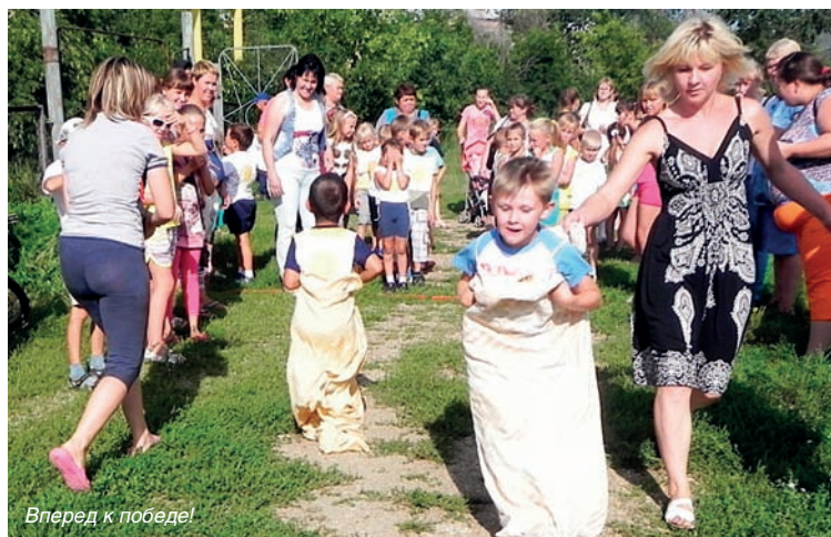
Вперед к победе!

Коелгинское поселение Еткульского района Челябинской области богато своими спортивными традициями. Спорт в селе всегда держался на истинных энтузиастах – людях преданных физической культуре и спорту.