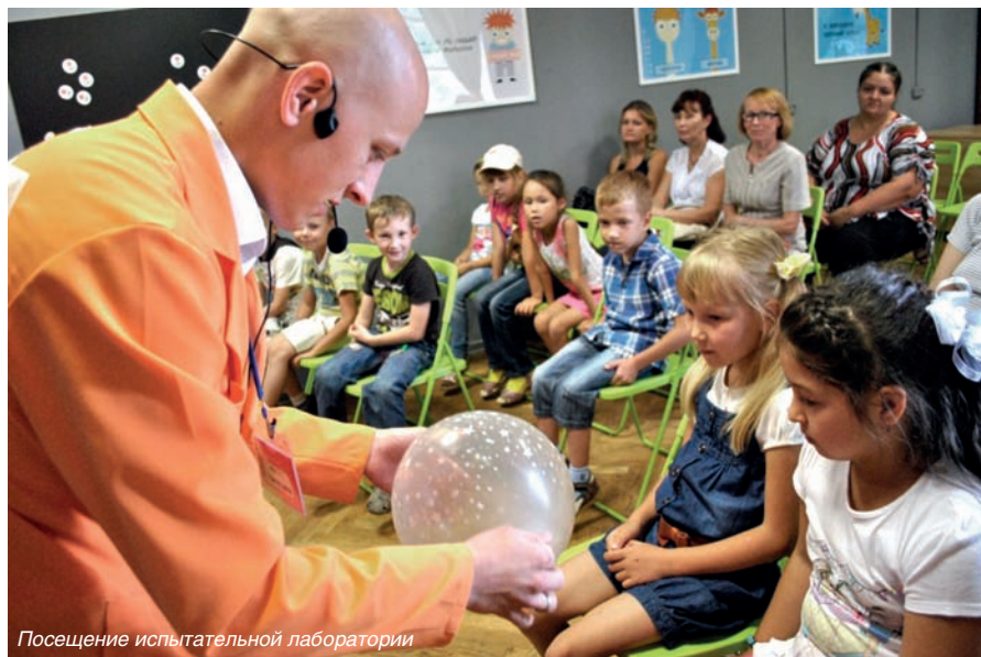
Посещение испытательной лаборатории

Вот и настал тот момента, когда прозвенел первый школьный звонок, знаменуя начало нового учебного года. Для одних 1 сентября – еще один «День знаний» школьных лет. Для других же, главных героев этого дня – первоклашек – первый и долгожданный!