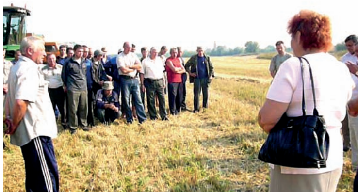
Подведение итогов трудового соревнования

подразделений по всему кругу социально– трудовых вопросов.