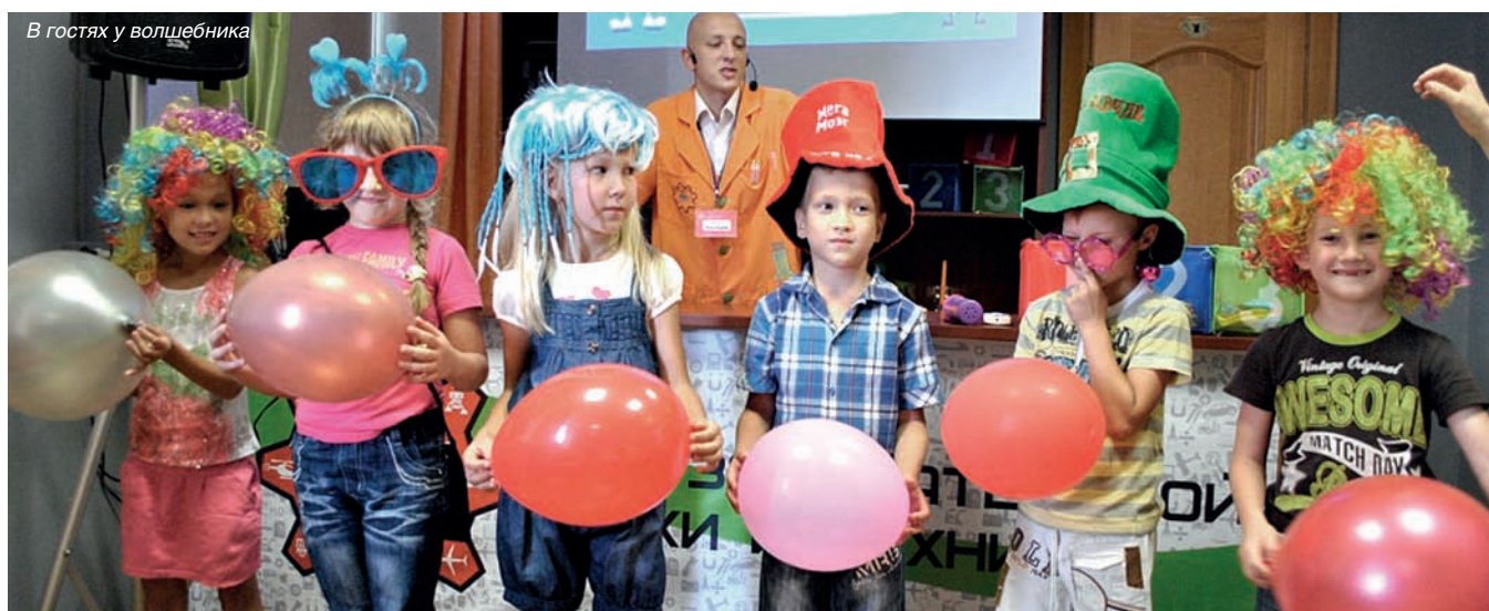
В гостях у волшебника

24 и 25 августа три экскурсионных автобуса выехали в Казань. Программа поездки была насыщенная, информационно-обогащенная, развлекательно-познавательная. Еще на выезде из родного города Набережные Челны ребята познакомились с его историей. Узнали, как и в каком году на берегах Камы появились первые его жители. А так же, как появился поселок ЗЯБ, и почему его так называли, где находится самый старинный дом в поселке ГЭС, а так же когда и как начали строить