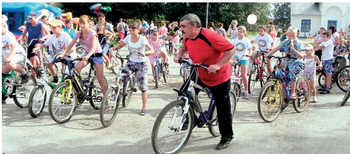
На старт! Внимание....

Пресс-центр Челябинского областного комитета Профсоюза