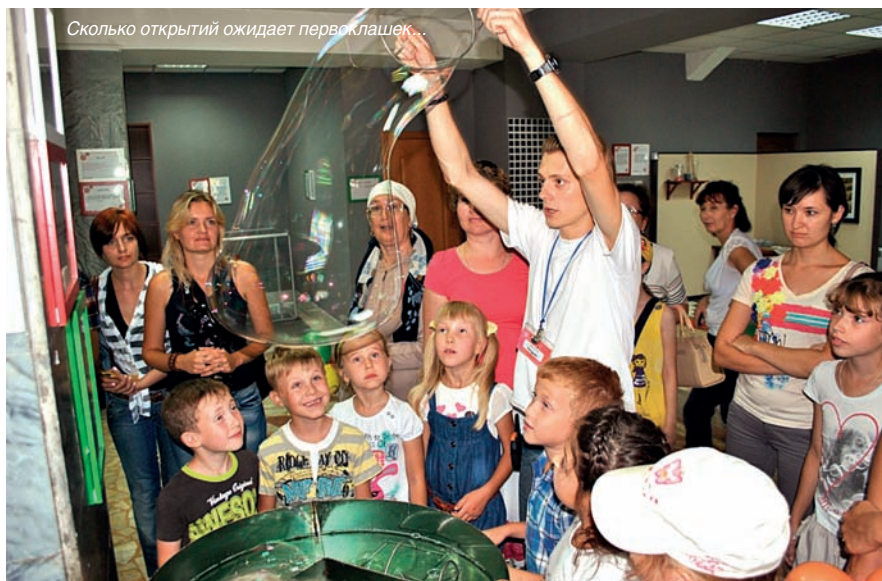
Сколько открытий ожидает первоклашек...

Здесь же в «Доме занимательной науки и техники» ребятам вручили набор первоклассника, который включил себя все необходимые принадлежности для учебы в школе, а родителям материальную помощь в размере одной тысячи рублей каждому. «Это очень большой праздник и очень ответственный момент и для вас, ребята, и для ваших родителей. Желаем вам успехов в учебе, а родителям терпения», — поздравила будущих первоклассников и их родителей