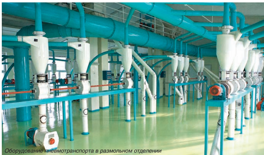
Оборудование пневмотранспорта в размольном отделении