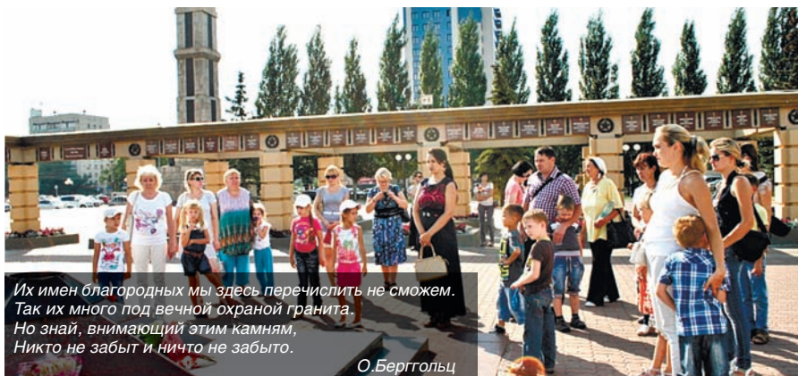
Их имен благородных мы здесь перечислить не сможем. Так их много под вечной охраной гранита. Но знай, внимающий этим камням, Никто не забыт и ничто не забыто.